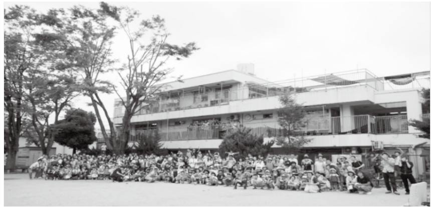
ありがとう会は創立以来の懐かしい方も400名近い大同窓会に