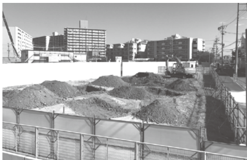
建設中のやだ保育園

民間移管で開園して三年目となり、当初の予定通り、現在の保育園の南側に新しいやだ保育園の建設がはじまりました。三月の完成が楽しみです。