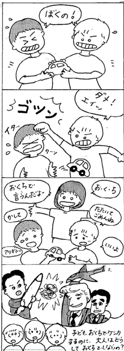
子どもおくちぞケンカするのに、大人はどうしておくちぞしはりの？