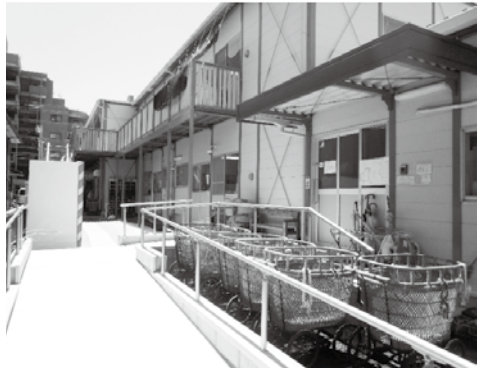
めいほく保育園仮園舎

思い出のある園舎との別れはさみしいですが、新しくなる園舎をたのしみに新たな歩みをすすめていきます。