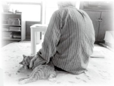
たのしく暮らさんとね 町南の家 利用者

り前のこと。だけれども現実にはその変化の先行きに不安・心配・恐れなど様々なマイナス要因ばかりが大きいのしかかってきてしまう社会状況があります。私たちは、高齢者、障害児者ご本人はもちろん、ご家族を含め住み慣れた地域の中でその人らしく、その人なりに暮らしていきたいという想い・願いに寄り添い、かつ人権と尊厳を守り、支え続けていくことに全力を傾けていきます。ながい一回一回のヘルパー支援を重ねていく中で利用者ご本人、ご家族の信頼を得ていけるよう努めていきます。不安・心配を安心へと変えていけるヘルパー支援、ヘルパー事業所を目指していきます。