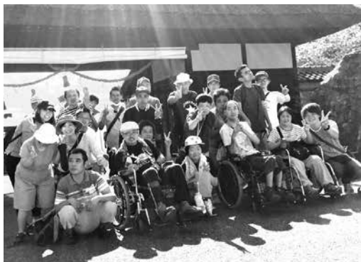
楽しいことが したいです! (安井の家仲間)

分たちで育てたさつまいもで作ったおやつはどんなにも良く食べられていました。毎週木曜日には音楽・スポーツを通じて自己表現をする「りんりんズ・らんらんズ」二グループを編成しました。よさこい踊り・スポーツグッズを使ったレクリエーションでみなさん生き生きと活動されています。今年も仲間たちと