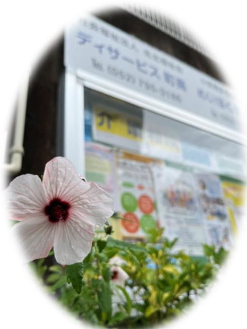
デイ町南玄関前の掲示板

発行 社会福祉法人名北福祉会 デイサービス町南 TEL 052-795-3186 めいほく町南の家 TEL 052-778-7168 FAX 052-799-3666 名古屋市守山区町南 19 番 27 号