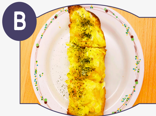
たまごトースト セット 430円