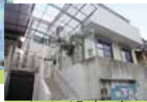
めいほく町南の家