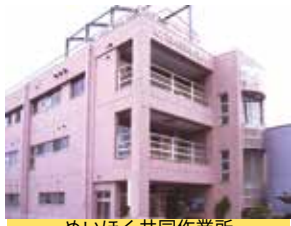
めいほく共同作業所