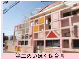
第二めいほく保育園