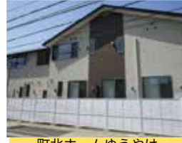
町北ホームゆうやけ