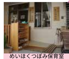
めいほくつぼみ保育室