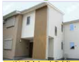
めいほくホームあさひ