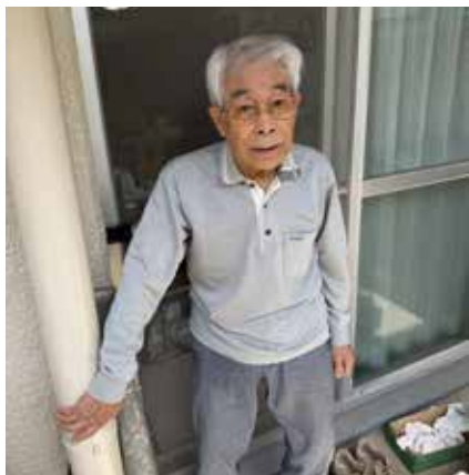
「いつもありがとう」「93歳お一人暮らし」

名北の理念である「平和・住みよい街づくり・福祉の充実」を掲げて職員一同が成長できる年度を目指します。研修を増やし、質の高い介護・支援を提供することで利用者の「安心」と「笑顔」が増すよう努めます。また、今年度は、第5次中期計画（2022）