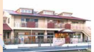
なえしろ保育園 子育て支援センターなえしろ