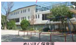
めいほく保育園 子育て支援センターめいほく