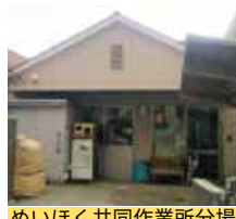
めいほく共同作業所分場