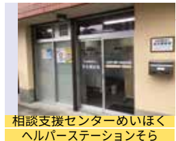
相談支援センターめいほく ヘルパーステーションそら