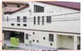
めだか保育園 子育て支援拠点事業めだかひろば