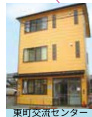
東町交流センター