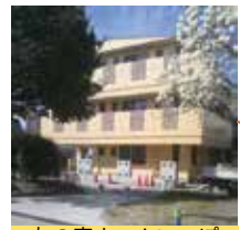
友の家ホームいっぽ