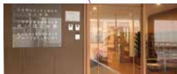
グループホームめいほく めいほくの家