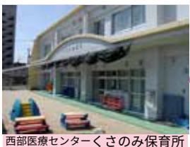
西部医療センターくさのみ保育所