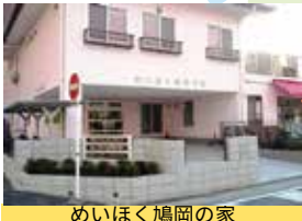
めいほく鳩岡の家