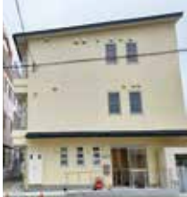
友の家ホームにほ