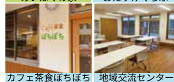
カフェ茶食ぼちぼち