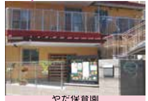
やだ保育園 子育て支援拠点事業やだっこひろば