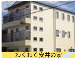
わくわく安井の家