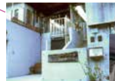
デイサービス町南