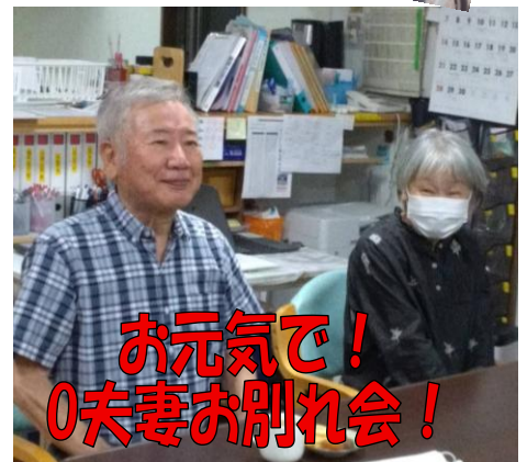
お元気で！ 0夫妻お別れ会！