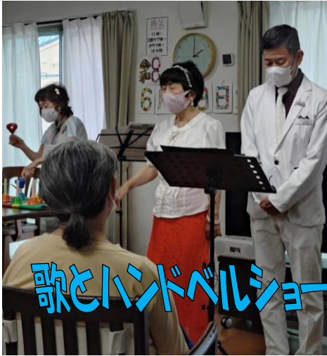
歌とハンドベルショー

今月「町南の家」が開所して10年に。早いものですね。ささやかなお祝い会します。ぜひおいでください。 あちこちで地震があり心配なこの頃ですね。能登地方の福祉施設の現状を聞く機会が。地元に戻りたくても戻れない現状。地震時、入所施設に200名の方が避難してきました。先日、事業所でも災害時の対応について研修、もつと実効あるものにならないといけませんね。